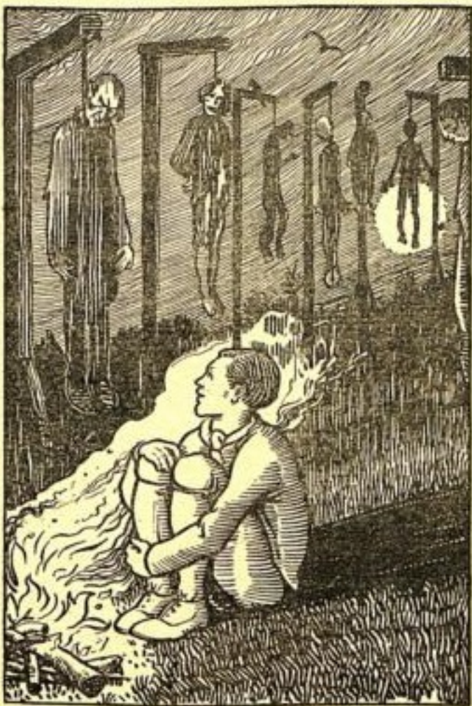
Si moi déjà, près de ce feu, je gèle, que ne doivent pas souffrir ces pauvres diables là-bas ?