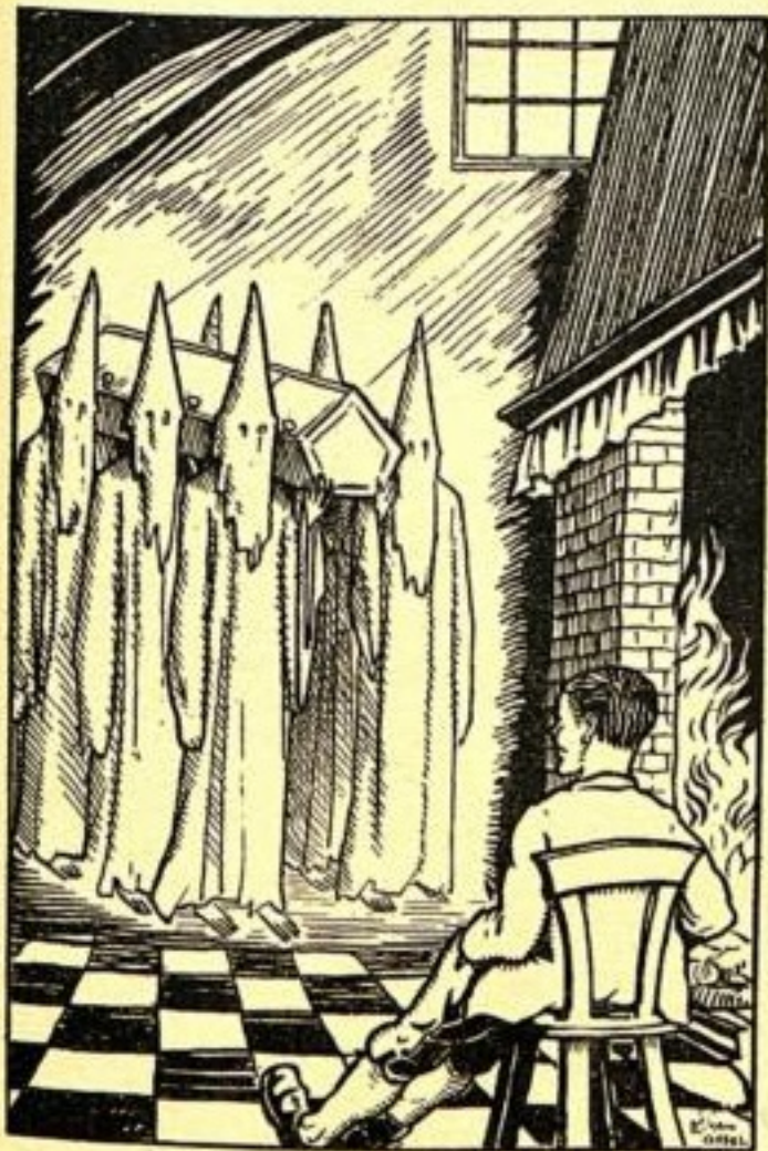
Six hommes rouges en cagoules apportent un cercueil.

— Pas l'ombre, patron, fit Paul, je n'ai pas fait en cela le moindre progrès. Si seulement je pouvais apprendre ce truc-là!