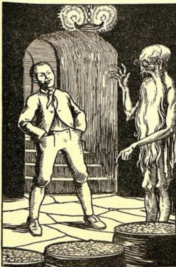
— Le premier coffre sera pour les pauvres. 66clara-1-11.

La troisième nuit arriva. Paul fit un feu clair et vif et, s'asseyant sur le banc du tour, il soupira :